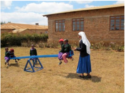
CMM Sisters at Work in Tanzania (see page 4)