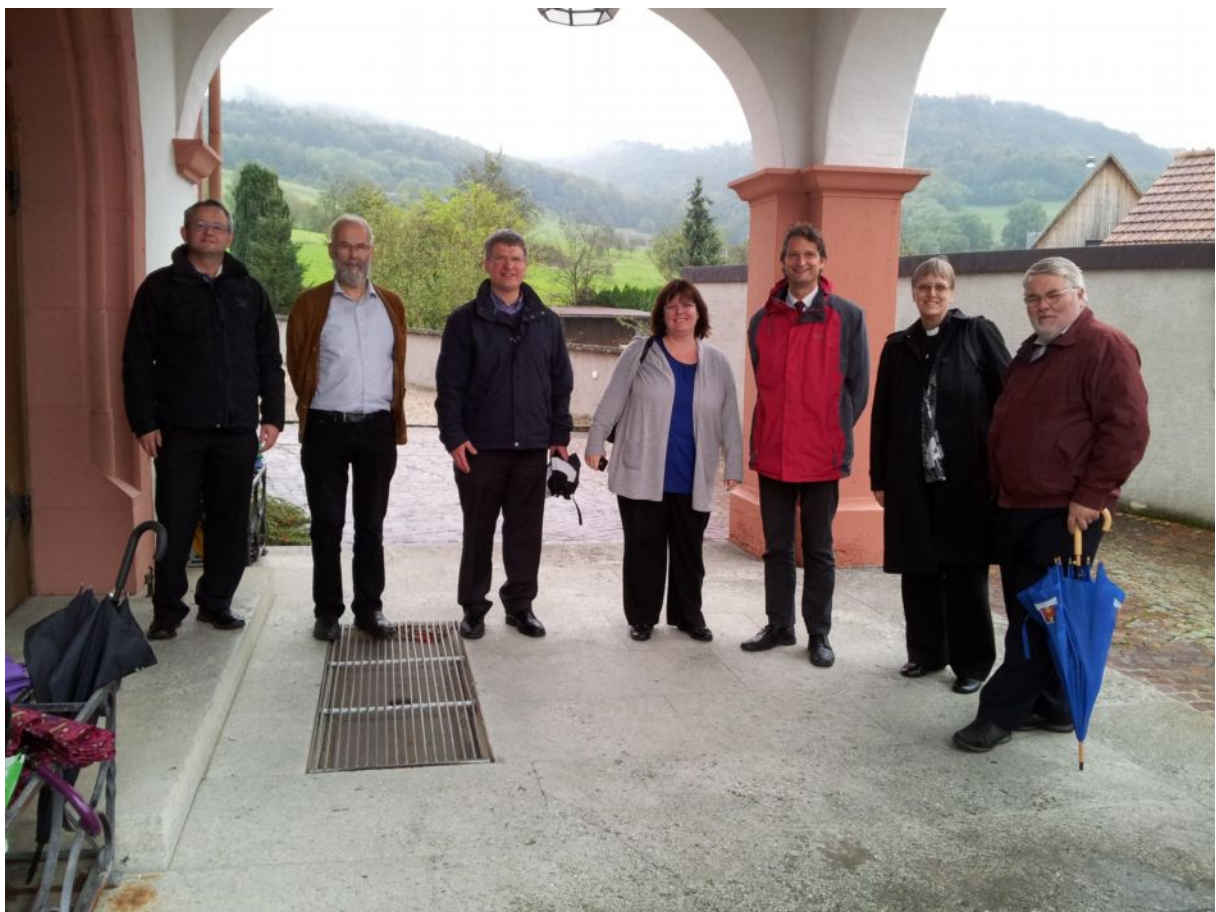
SSW Day at Wegenstetten